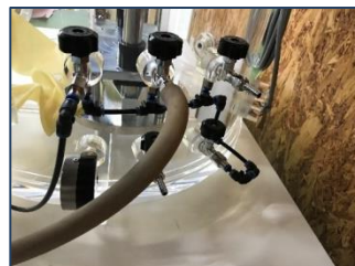
ガス置換ポート2口