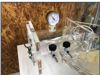
サイドボックス・圧力計